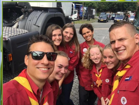
Explorerkamp 2017- onderweg naar Brexbachtal