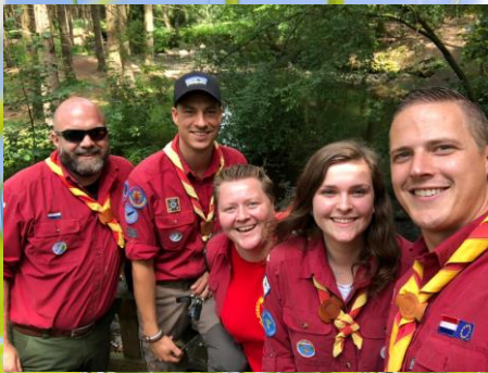
Explorerkamp 2019 Rotterdam